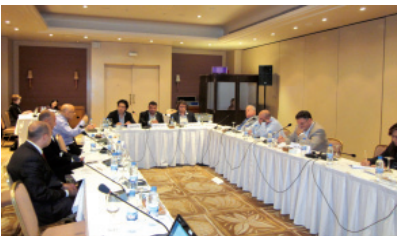
Participants to the panel meeting

The first session focused on prioritization and discussion of trends leading to conflict. Participants evaluated each trend by examining its impact on and probability of leading to conflict. As a result, these evaluations produced a well-structured analysis of which trends are likely to have the most influence in the development of conflicts in Lebanon.