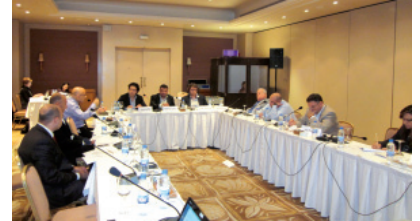
المشاركون في ورشة العمل

استضاف المركز اللبناني للدراسات ومبادرة إدارة الأزمات الفنلندية ورشة عمل في 5 تشرين الأول 2011 في فندق موفنيك قام خلالها أعضاء من البرلمان ومستشارون حكوميون بتحليل الاتجاهات الاقتصادية والبيئية والاجتماعية والسياسية وتقييم علاقتها بنشوب الصراعات المحتملة في لبنان. ركزت الجلسة الأولى على تحديد الأولويات ومناقشة الاتجاهات التي تؤدي إلى الصراع. فقيم المشاركون كل اتجاه من خلال دراسة تأثيره على واحتمال أن يؤدي إلى صراع. نتج عن هذه التقييمات تحليلاً منظماً عن الاتجاهات التي يحتمل أن يكون لها التأثير الأكبر في تطور النزاعات في لبنان.